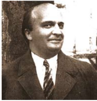
Lew Schubnikow, ca. 1935